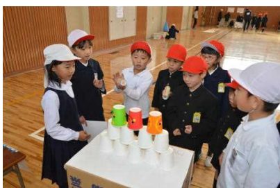
11/29 1年2年 おもちゃフェスティバル