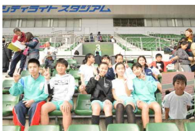
11/17 岡山市陸上記録会参加