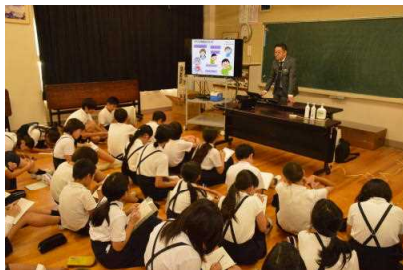
9/25 保健委員会「菜のお話」