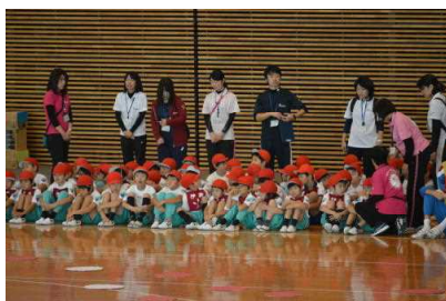
11/1 ひまわり学級 なかよしフェスティバル