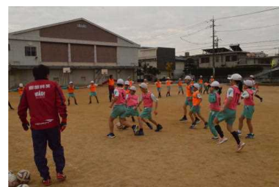
12/19 12/20 5年6年 ファジャーノ岡山来校