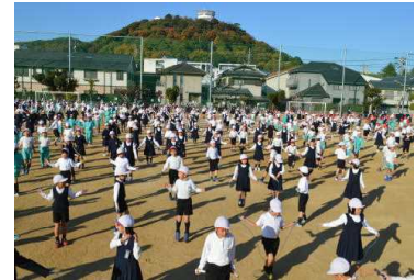
さわやか運動 全校縄跳び

2学期、子どもたちを支えてくださった保護者の皆様の温かいご支援と見守りに感謝申し上げます。また、子どもたちの様々な学習や活動にご支援とご協力を賜りました地域の皆様、ありがとうございました。引き続き、3学期もどうぞよろしくお願い申し上げます。