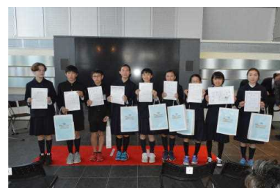
11/23 税に関する絵はがき表彰