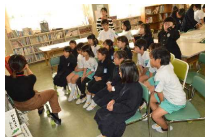
読み聞かせ(図書館で随時)