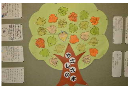
低学年「やさしさの木」

人権週間の期間中に、低学年は人の良いところを見つける「やさしさの木」をクラス毎に作成し、中学年は人権に関する標語を作成し、高学年は各自人権宣言をしました。