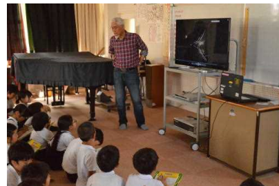
9/27 3年 昆虫のお話