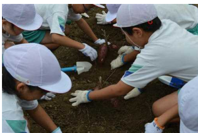
10/2 2年 いもほり