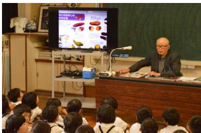
9/24 2年 いものお話

2学期も地域の方々、PTAの方々にはたいへんお世話になりました。 ありがとうございました。