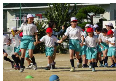
1年6年 ハッピーにこここタイム